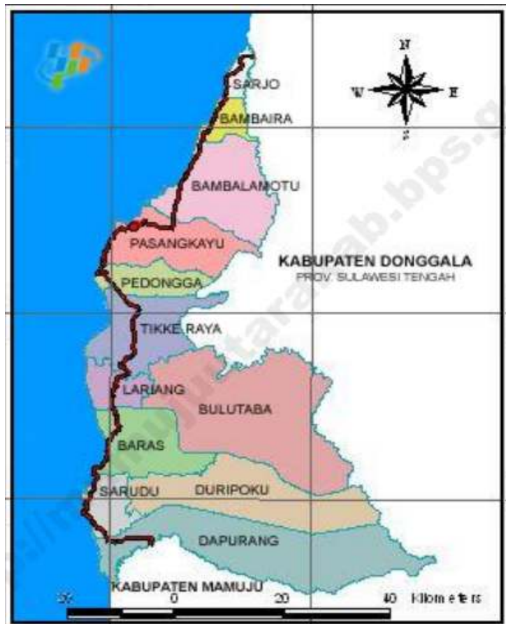
Gambar 2.1. Peta Kabupaten Pasangkayu

Sejak berdirinya, Kabupaten Pasangkayu telah mengalami perkembangan yang cukup signifikan dalam bidang pemerintahan, dimana pada awalnya terdiri dari 4 (empat) Kecamatan, namun saat ini telah dimekarkan menjadi 12 kecamatan.